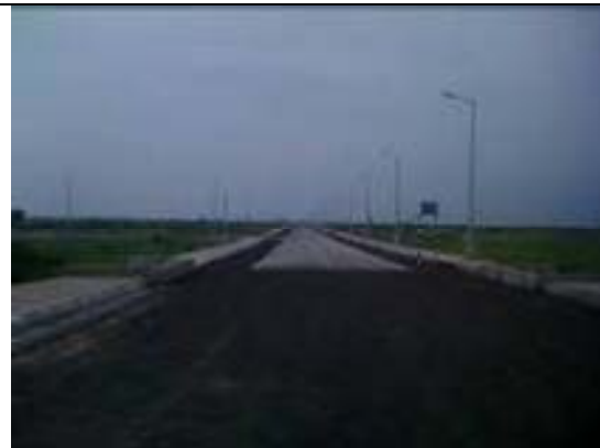
グジャラート州タヘジ経済特区内のアクセス道路