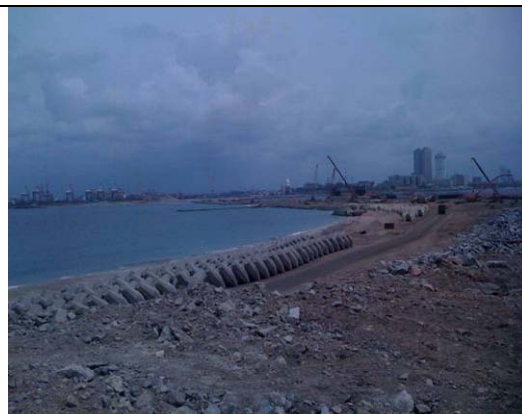
拡張工事が進行中のコロンボ港