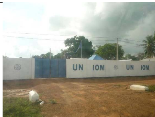
北部地域の国際援助