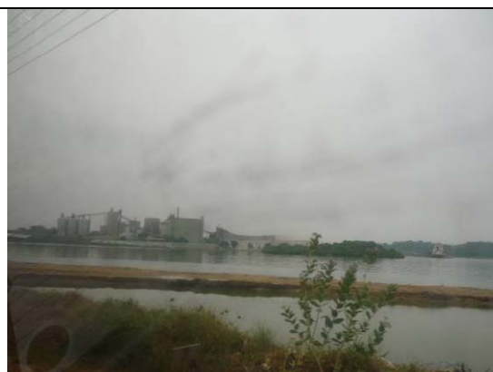
トリンコマレー港に隣接するセメント工場