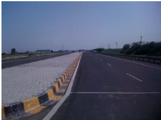
グジャラート州の主要都市アーメダバードから工業団地候補地サナンドまでの道路