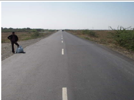
グジャラート州のアーメダバードから工業団地候補地ドレラに続く道路