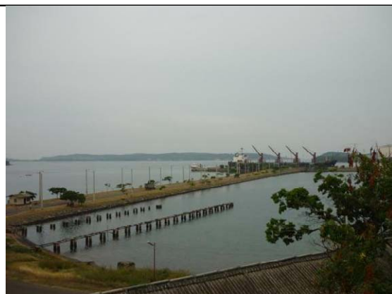
トリンコマレー港のジェティー