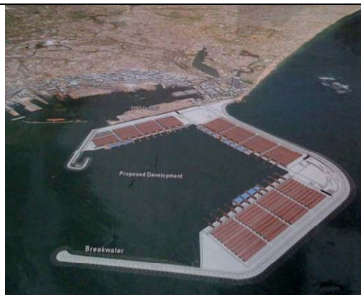
コロンボ港で進行中の港湾拡張計画