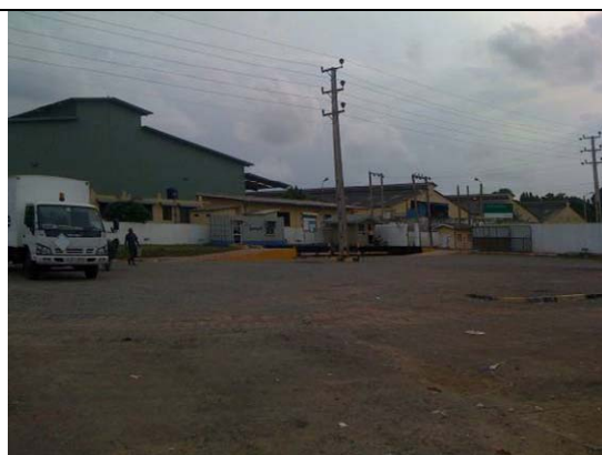
空港近くに位置するカトヤナケ工業団地