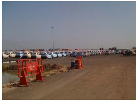
サナンド工業団地候補地に隣接するタタ・モーターズのナノ自動車工場